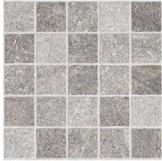
CARTAGO NICKEL PEI IV

Medium shade variation Distonificación media