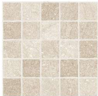
CARTAGO LAND PEI IV