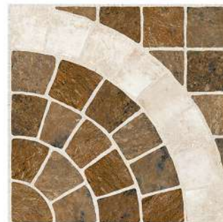
ARC CARTAGO VOLCAN PEI III