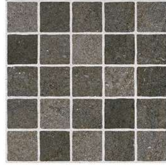
CARTAGO BASALT PEI III