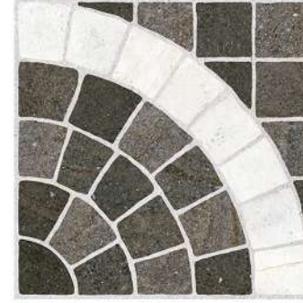
ARC CARTAGO BASALT PEI III