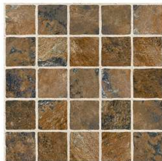
CARTAGO VOLCAN PEI III