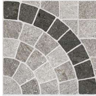
ARC CARTAGO NICKEL PEI III