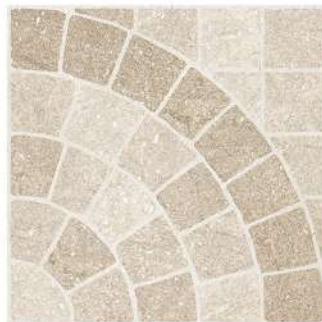
ARC CARTAGO LAND PEI IV