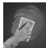
dokončno sperite površino