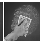
konačno isperite površino

Upozorenje: NE KORISTITE TEČNOST ZA ČIŠĆENJE NA ALUMINIJUMSKIM, PLASTIČNIM, HROMIRANIM I AKRILNIM POVRŠINAMA, JER IH MOŽETE OŠTETITI!