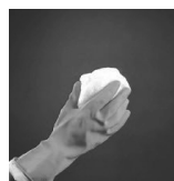
očistite površino stekla in nanesite KOLPA SAN ZAŠTITNI PREMAZ

Plastičnu bocu sa zaštitnim premazom pre upotrebe dobro promućkajte. Krpicom ravnomerno nanesite KOLPA SAN ZAŠTITNI PREMAZ na očišćenu površinu stakla. Sačekajte najmanje 40 minuta da se osuši. Ako je prostor vlažan, sačekajte još dodatnih 10 minuta. Obrišite površinu vlažnom krpom i operite je neabrazivnim deterdžentom kako biste uklonili ostatke premaza, zatim osušite površinu. Ako premazom niste prekrili celu površinu, možete po potrebi da ponovite postupak kada je površina suva.