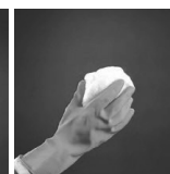
nanesite KOLPA SAN ZAŠTITNI PREMAZ